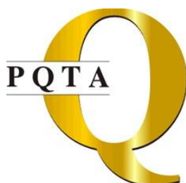
PQTA OURO 2014